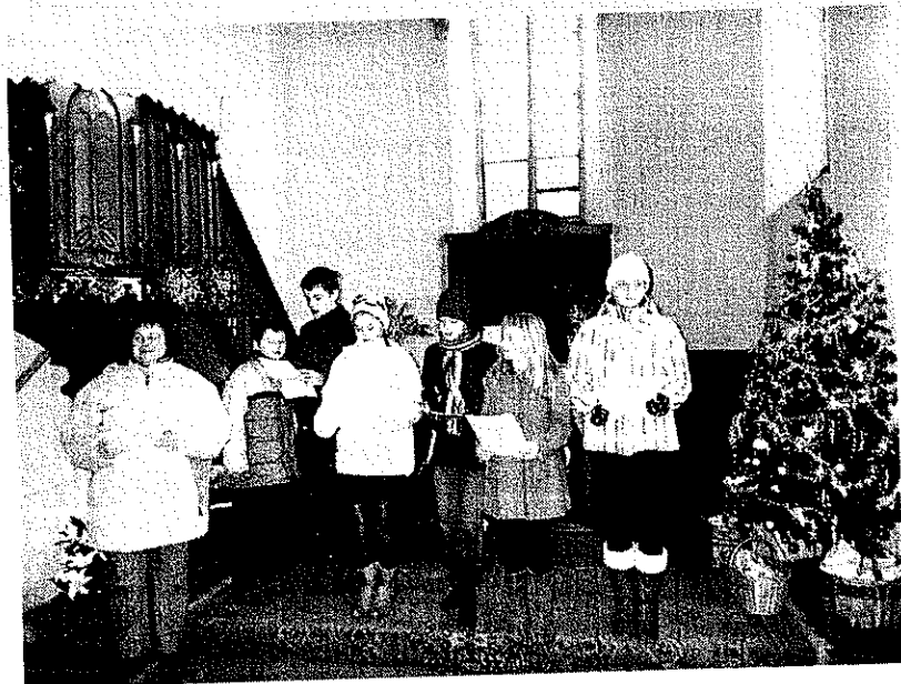
Vánoční slavnost v kostele sv. Ducha v Telči