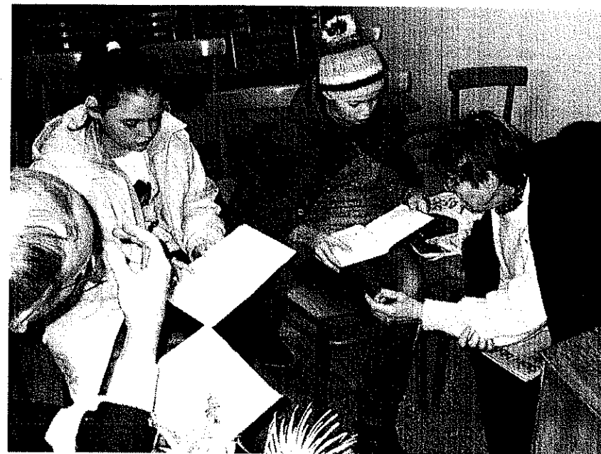
Vyučování v Dačicích