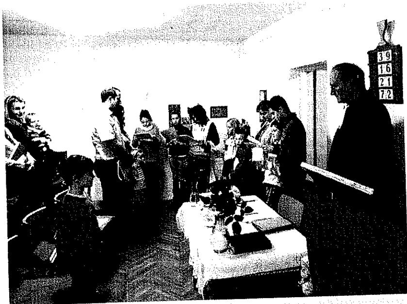
Rodinná neděle ve sborovém domě v Telči