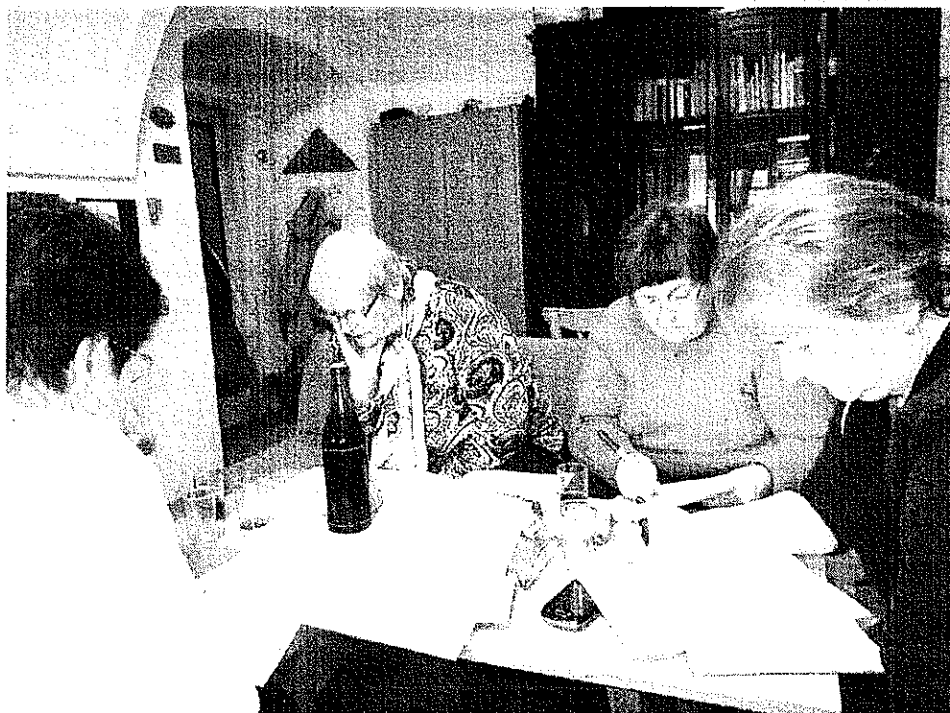
Schůze staršovstva v Telči nad otázkami o budoucnosti našeho sboru