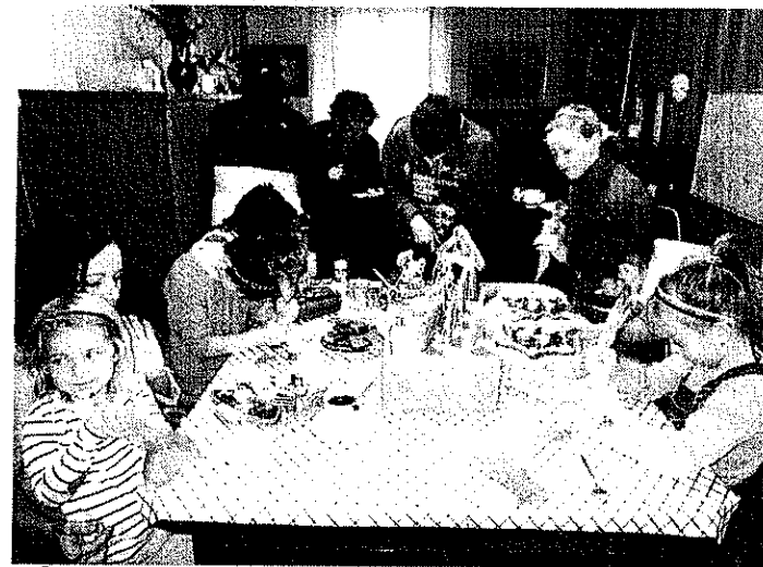
výroba vánočních předmětů na rodinné neděli v Telči