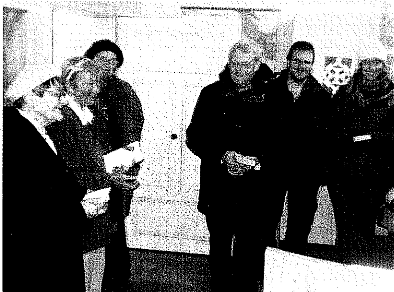
návštěva zahraničních studentů z USA v Telči a Slavonicích (organizovala Evangelická teologická fakulta Univerzity Karlovy)