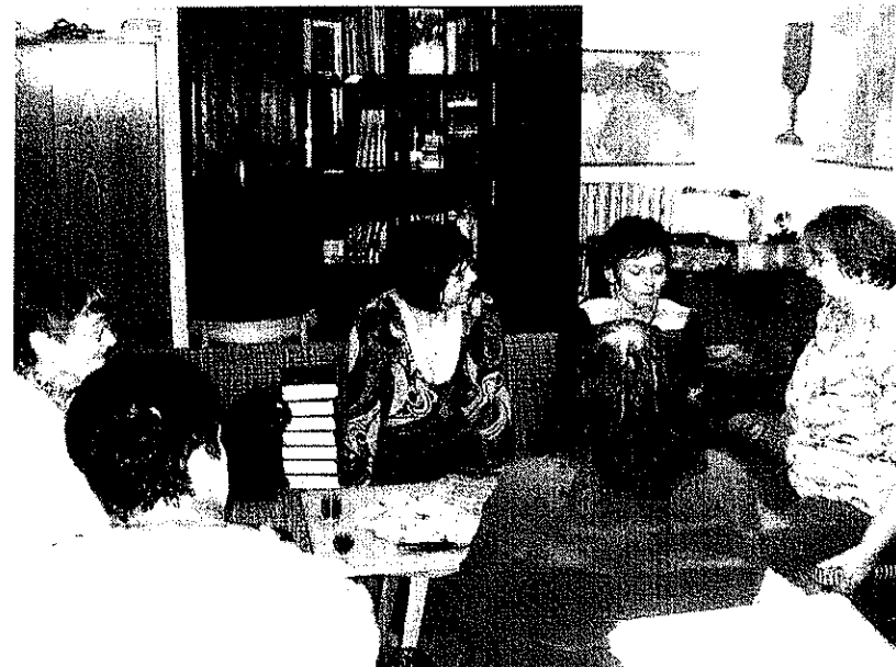
pravidelná setkávání střední generace ve sborovém domě v Telči