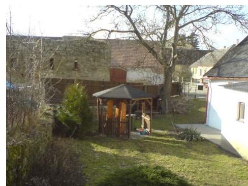
Nový plot ve Slavonicích