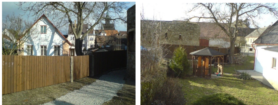
Nový plot ve Slavonicích