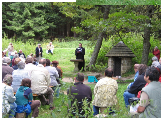
U Studánky Páně