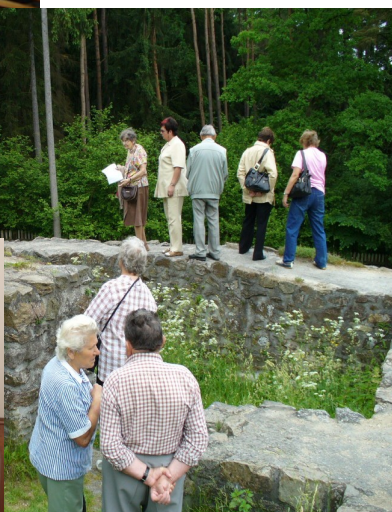
Konfirmace v Telči