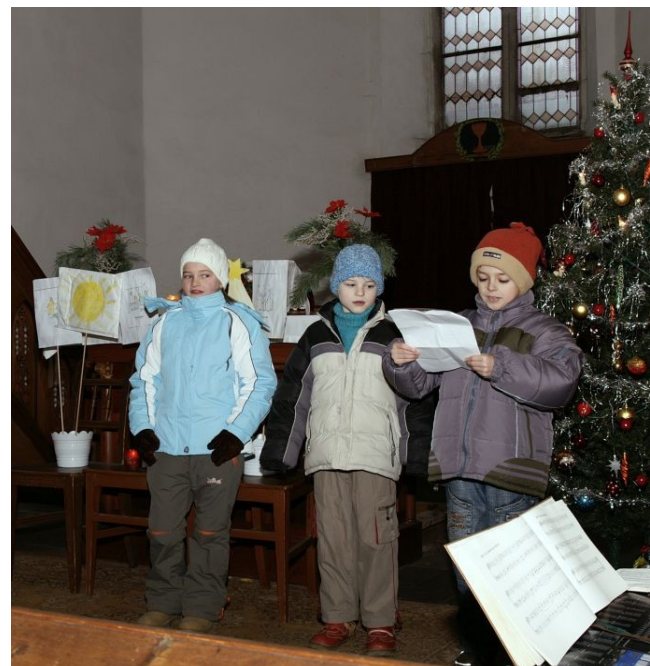
Vánoční slavnost a rodinná neděle v Telči