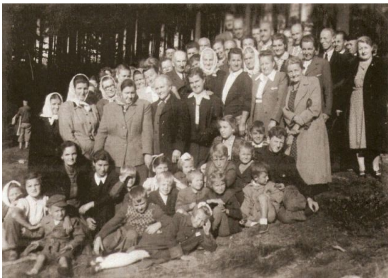
Z dávných dob: poslední setkání u Studánky Páně před jeho zákazem počátkem 50. let (obnoveno r.1990). Účastníci z našeho sboru: Telč, Dačice, Slavonice.